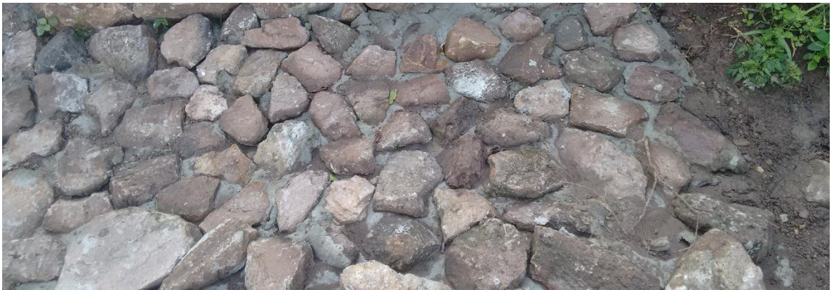
Enrocado de protección en k1-700