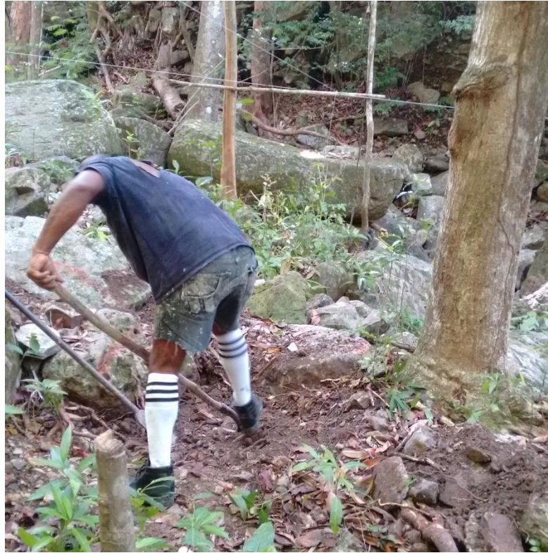
Excavación para pedestales en el k1-803