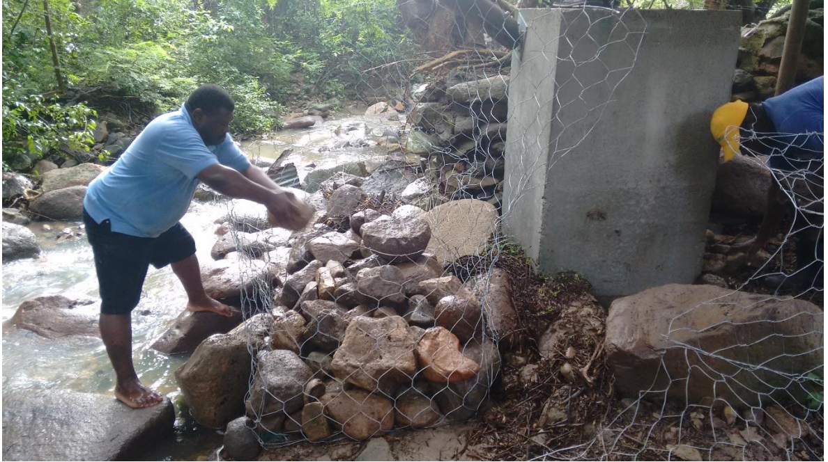
Llenado de mallas para gaviones en k0-120