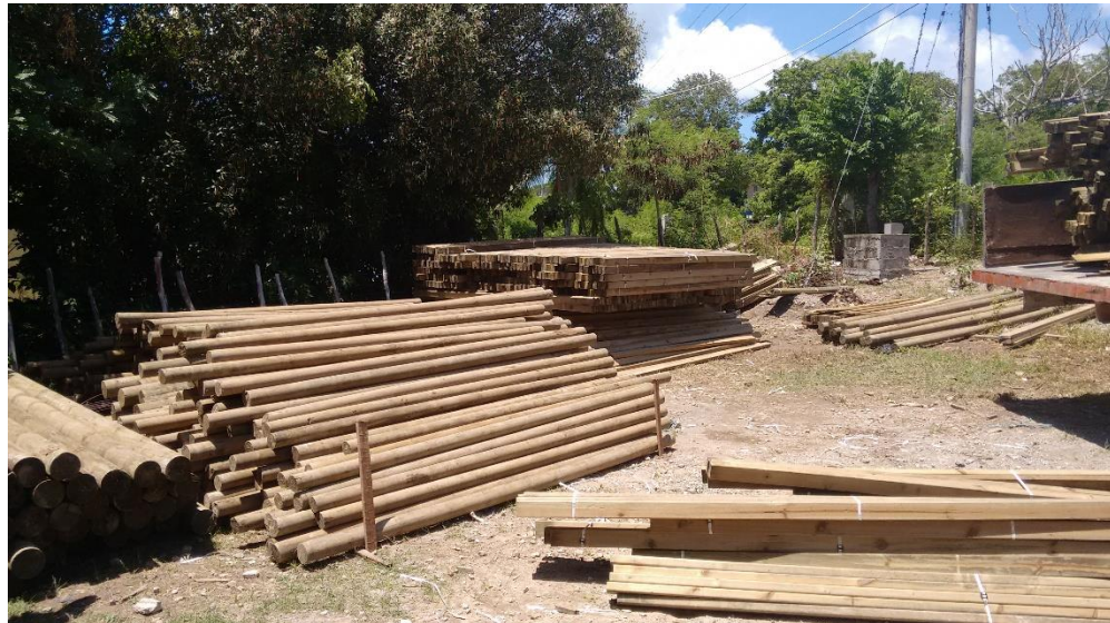
Almacenaje de madera para puentes

CALLE 7 B No. 46-43, VILLAVICENCIO (META). TEL.: 321 358 8054